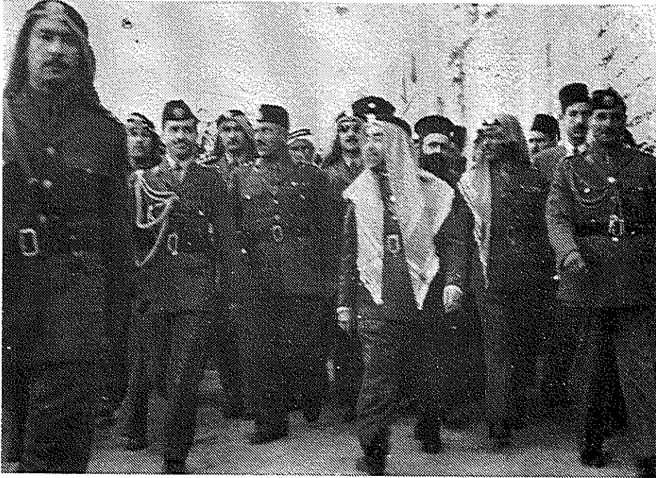
ביקור המלך עבדאללה בירושלים (אוקטובר 1948)

למטרה זו. ערב סיום ההפוגה הראשונה החליטה הליגה הערבית על הקמת ממשל עצמי פלסטיני, שיהיה אחראי לענייניה של האוכלוסייה בשטחי הכיבוש הערביים. ממשלות ערב לא עשו דבר כדי להגשים החלטה זו, אך כחודשיים לאחר מכן, בהשראת ממשלות מצרים וסוריה, עשתה הליגה צעד נוסף בכיוון זה בכוננה בעזה את 'ממשלת כל פלסטין'. 141 כשרים בממשלה מונו אישים מהוועד הערבי העליון, שהיו מקורבים למופתי, וכן אישים ממתנגדיו, במטרה להרחיקם מעבדאללה. התנגדותו הפומבית של המלך עבדאללה לממשלה זו, שנמשכה גם לאחר שכל מדינות ערב האחרות הכירו בה, הבליטה את בידודו בזירה הבינערבית, ושבה וחשפה את תהום העוינות ואי-האמון בינו לבין שליטי מצרים וסוריה. פעולתם של המצרים לחיזוק תומכי המופתי בחלקה הכבושים של הארץ הוסיפה מכשול מקומי על דרך הגשמת שאיפתו של המלך לבסס את מרותו בשטח הערבי של הארץ, מה גם שצבאו שלט בפועל רק בחלק ממנו.