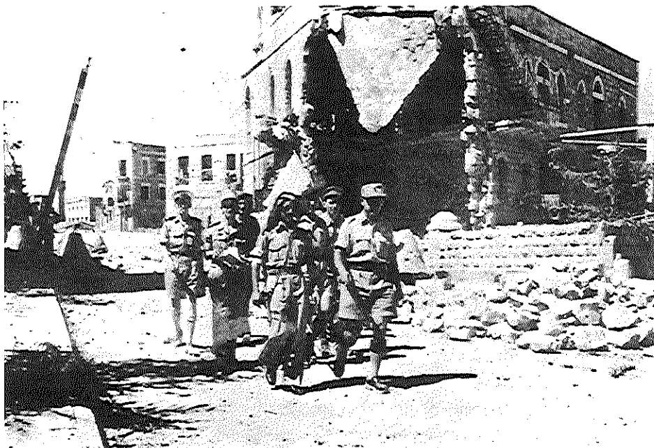
קביעת גבולות קו שביתת-הנשק בירושלים

ישראל למלווה בסך 100 מיליון דולר למטרות פיתוח וקליטת עלייה. 130 על שיקול זה נוספה גם הבהרת הרשמית והחד-משמעית של ממשלת ארצות-הברית — בפגישת הנציג האמריקני המיוחד עם שר-החוץ שרתוק, ב-7 בספטמבר — כי תפעל בכל כוחה כדי לננוע הפרת ההפוגה, וכי במקרה שתופר ההפוגה תתמוך בפעולה מיידית של מועצת-הבטחון נגד התוקפן. באותה הזדמנות ביקש הנציג האמריקני לדעת אם יש מדינה ערבית המוכנה להיכנס למשא-ומתן על שלום עם ישראל, והזכיר את האפשרות להסכם עם עבר-הירדן על בסיס חילופי שטחים (הנגב תמורת הגליל המערבי) וכן הסכם על ירושלים. בהקשר זה קבעה ארצות-הברית עמדה רבת-משמעות לישראל ועבר-הירדן, לאמור, ארצות-הברית מוסיפה לתמוך בבינאום ירושלים, אך תהיה מוכנה לשיקול קבלת כל הסדר שיספק את ישראל ומדינות-ערב ואשר יבטיח את שלום המקומות הקדושים והגישה אליהם. עמדה זו היתה שינוי מהותי בגישת ארצות-הברית, ובן-גוריון היה מוכן לאמצה מיד, מן הסתם בשל הסיכוי שהבטיחה השלמה מצד ושינגטון להכללת העיר העברית והפרוודור בתחומי מדינת ישראל, בתנאי שתושג הסכמה עם עבדאללה. 131 בתשובה לשאלת נציג ארצות-הברית בישראל, ג'יימס מקדונלד, מסר שרתוק באותה שיחה מידע חלקי בלבד על המגעים בין ששון לחיידר, אך אין ספק כי בדיווחו על תגובתו של עבדאללה הותיר אצל הנציג האמריקני רושם ברור שהמלך מוכן להתקדם לקראת משא-ומתן מדיני עם ישראל.