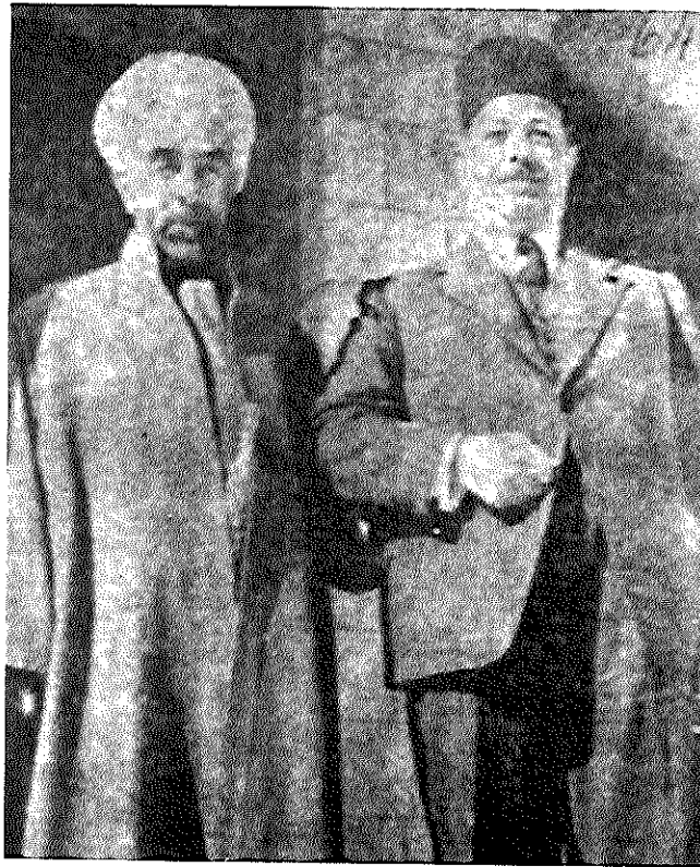
המלך עבראללה וראש ממשלת מצרים נקראשי פאשא (יוני 1948)

שלפיה פעלו שני הצדדים בירושלים מלכתחילה להשגת יעדים מוגבלים מתוך רצון להימנע מהכרעה, מחשש שהדבר יביא לבינאום העיר — טענה זו היא חסרת-יסוד. לגבי הלגיון לא היתה קיימת אפשרות מעשית או כוונה להכרעה בירושלים בשום שלב של המלחמה, ואילו לגבי ישראל נכונה טענה זו רק מבצע 'יואב' ואילך. אמנם לא חסרות עדויות לחששות של בן-גוריון ומנהיגים ישראלים אחרים מפני תגובת העולם הנוצרי על כיבוש המקומות הקדושים לנצרות בירושלים העתיקה, או על פגיעה בהם, אולם שיקול זה היה משני בחשיבותו עד תום קרבות 'עשרת הימים' ויצירת 'דרך בורמה'. מה שעמד במשך תקופה זו לנגד עיני ההנהגה הישראלית היה ההכרח להבטיח את יכולת עמידתה של העיר העברית, שסבלה מכידוד ולרשותה עמדו כוחות מועטים. גם אם בירושלים היתה לכוח היהודי עדיפות יחסית, היא לא הספיקה להכרעת הכוחות הבלתי-סדירים בימים הראשונים לסיום המנדט, וחולשתו של הכוח היהודי נתגלתה לעין עם התערבות הלגיון. הנסיון לתלות את ההסבר לשוני בין האופי המוגבל כביכול של המלחמה שניהלה ישראל בירושלים לבין החתירה להכרעה בלטרון בחשש מפני בינאום, גם הוא אינו משכנע. ריכוז המאמץ הישראלי בנסיון להגיע להכרעה בלטרון ייצג תפיסה שהעדיפה יצירת פרוזדור רחב אל העיר, שיבטיח את הכללתה בתחומי מדינת ישראל, על-פני השקעת משאבים בהרחבת השליטה היהודית על חלקה הערבי של ירושלים. חולשתה של טענת החשש מפני בינאום בולטת גם על רקע האפשרות שהכרעה בלטרון היתה עלולה להתפתח למערכה על גב ההר ולהביא לכיבוש ירושלים רבתי.