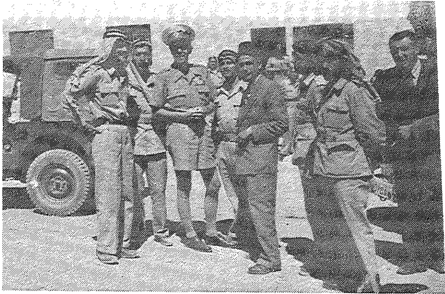
הרוזן ברנדוט מבקר במהלך ההפוגה במפקדת יחידת תותחנים באל- ג'יב

בזירה הבינערבית. לשם כך ערך ביקורים רשמיים אצל שניים מיריביו המושבעים — מלכי מצרים וערב הסעודית. 110