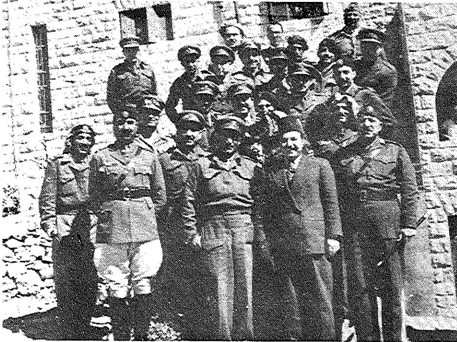
פרידה מן הבודות המצריים לפני נסיגתם מחברון (סוף אפריל 1949)

האוו"ם, בין המפקדים הצבאיים של שני הצדדים בירושלים ולהשגת הסכם הפסקת-אש כנה ומוחלטת בעיר ובסביבתה ב-30 בנובמבר. 154 ההסכם ציין למעשה את סיומו של העימות הצבאי בין ישראל לעבר-הירדן בחזית המרכז, וגבולות חלוקת העיר, שנקבעו בהסכם זה, קיבלו גושפנקה בהסכם שביתת-הנשק שנחתם בין ישראל ועבר-הירדן. הסכם דייין-את-תל על הפסקת-אש בירושלים היה בעל משמעות רחבה יותר, שכן הוא חל על כל קו החזית עם הלגיון, כולל לטרון, והעיד על מגמה לסיים את המלחמה עם עבר-הירדן. משמעות הסכם הפסקת-האש בירושלים, כצער נוסף בתהליך ההשלמה של שני הצדדים עם הסטטוס-קוו הצבאי, משתקפת במהלך ההיסטורי שנקט המלך למחרת חתימת ההסכם, בכנסו ביריחו ועידה שתכליתה להעניק לגיטימציה לתביעתו על השטחים הערביים של הארץ. הכינוס, שנערך בעידודו וסיועו של הלגיון הערבי ונודע לימים כ'ועידת יריחו', העניק למלך עבדאללה הכרה כ'מלך פלסטיין' ונתן לו למעשה ייפוי-כוח לפתור את 'בעיית פלסטיין' כראות עיניו. 155 ועידת יריחו החמירה את בידודו של המלך בזירה הבינערבית, והפכה אותו ליעד להתקפות והאשמות על ניצול הטרגדיה של ערביי פלסטיין לקידום שאיפות הסיפוח שלו. ואמנם, המלך היה להוט להגשים לאלתר את החלטות הוועידה ולספח באורה רשמי את השטח שבידי צבאו. בכך קיווה לסיים את המלחמה עם ישראל ולהקל את המצוקה הכלכלית שאליה נקלע. אלא שבעניין זה נתקל המלך בהסתייגות מצד